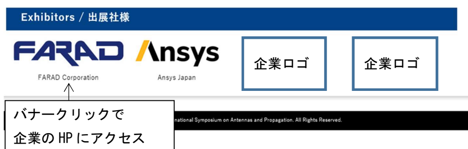
図1. 展示ページイメージ (現在のページをイメージとして引用させて頂きました。)