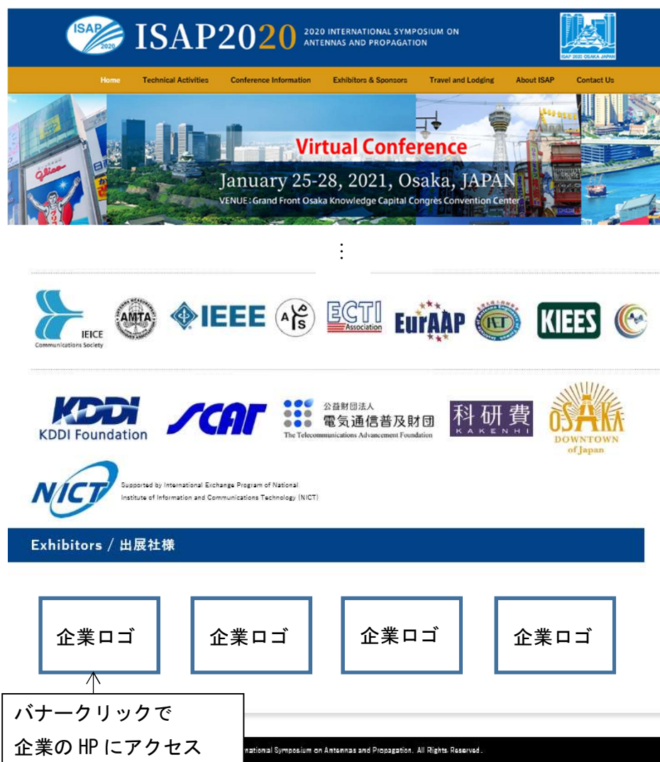
図2. 会議トップページ (OP) イメージ